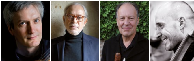
Gloires du Baroque