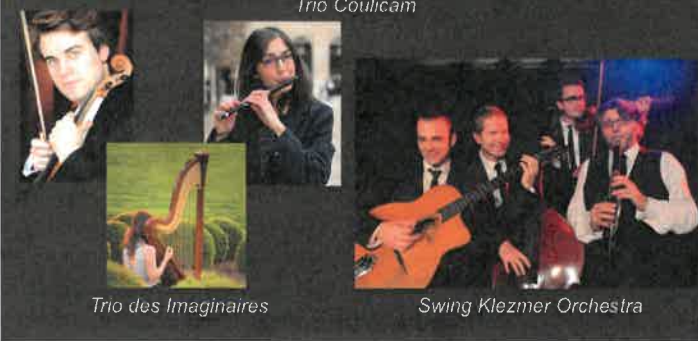
Trio des Imaginaires