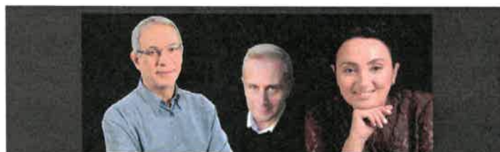
Trio Opératique Enragé