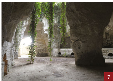
5. Maison à tourelle et pignon sur rue / 6. Anciennes halles, actuel jeu de boule de fort de « L'Union » / 7. Carrière de la propriété Bellevue