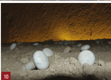
8. Maisons d'un marchand de tuffeau / 9. Abri troglodytique rue des Perreyeurs / 10. Champignonnière du Saut-aux-Loups

bateaux des mariniers pour être livrés dans toute la région. Ces carrières ont ensuite été réemployées pour d'autres activités telles que la production de prunes séchées. C'est le cas de la carrière dépendante de la maison Bellevue, dans laquelle on trouve un grand nombre de fours à prunes dont la construction remonte au moins au XVII e siècle.