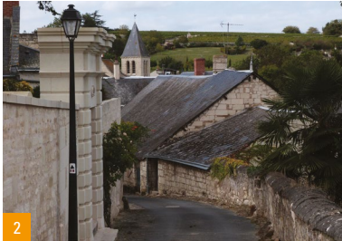
1a. L'église Saint-Pierre de Rest / 1b. L'ancien presbytère / 2. Vestiges de la « Grande Maison »